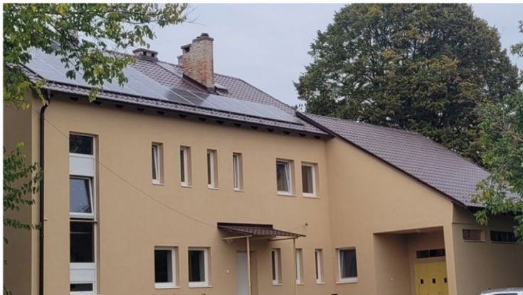
Szabó Sándor telepi Tábor utcai orvosi rendelő

Az intézmények kapcsán három nagy terve van még az