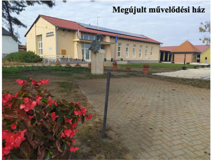
Megújult művelődési ház

önkormányzatnak a közeljövőt tekintve. Önerőből bővítik egy előtetővel a ravatalozó épületét, ennek építése már megkezdődött az elmúlt hetekben. Az előtető mellett elvégzik az épület külső és belső felújítását, és térköveznének is.