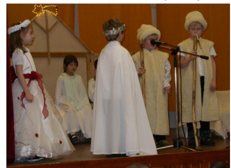
A képen a Lakótelepi Óvoda „Süni” csoportjának betlehemes játéka látható