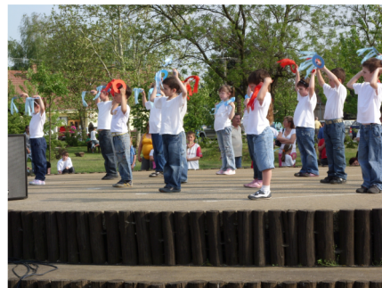
A Lakótelepi óvoda m sora