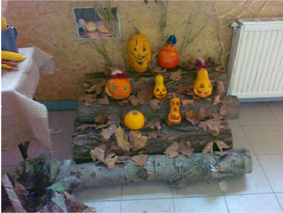
A „Tök jó” kiállítás részlete