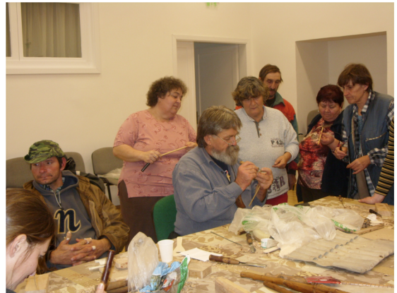
„Építő közösségek Bács-Kiskun megye három kistérségének 15 településén”

egy kisebb, gyakran hulladéknak tekintett fadarabból is lehet hasznos tárgyat készíteni, amit a ház körül, vagy a konyhában fel lehet használni, esetleg el lehet ajándékozni. A jelenlévők a az egész napos foglalkozáson fából készült tartót, majd nádsípkokat készítettek.