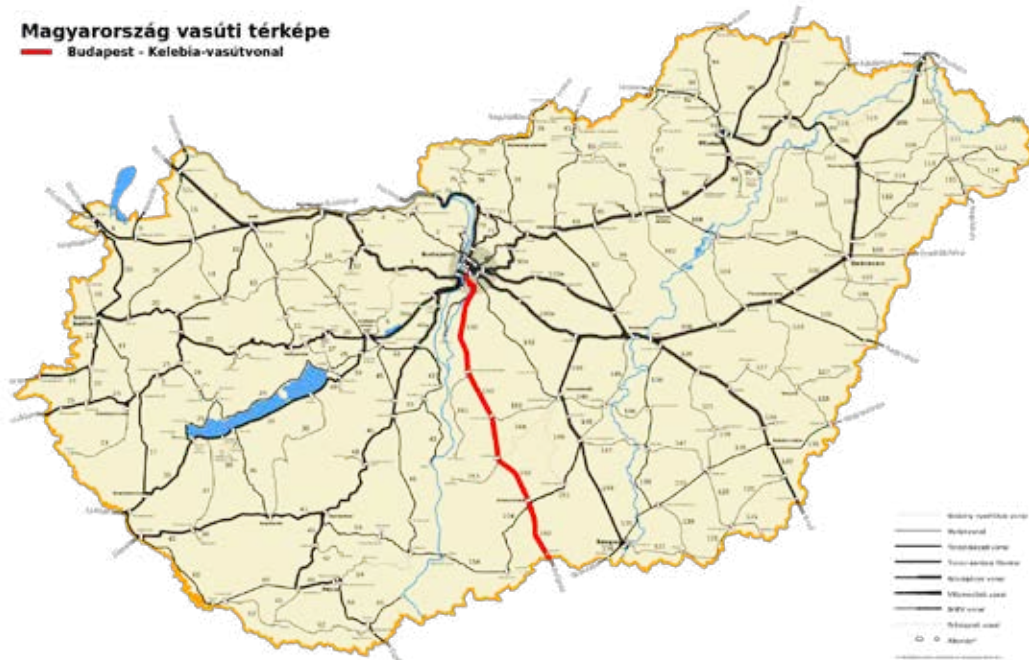
Magyarország vasúti térképe — Budapest - Kelebia-vasútvonal

A nemzetközi Egyezménynek megfelelően a MÁV Zrt. és a kijelölt kínai társaságok megalapították a Kínai-Magyar Vasúti Zrt.-t, amely a korszerűsítésért felelős tervező és kivitelező kiválasztására irányuló, nyílt beszerzési eljárás előkészítéséért és lefolytatásáért, a szerződések megkötéséért, valamint a megvalósítás fázisában a projektmenedzsment és a monitoring tevékenységek ellátásáért felel. A vegyesvállalat nem végez kivitelezési feladatokat, a tervező és fővállalkozó munkáját koordinálja. A munka már zajlik, ennek keretében a vegyesvállalat munkatársai megkeresték a Bács-Kiskun Megyei Önkormányzatot a lakosság érdekeit a lehető legteljesebb mértékben figyelembe vevő, érdemi párbeszéd kialakítása érdekében.